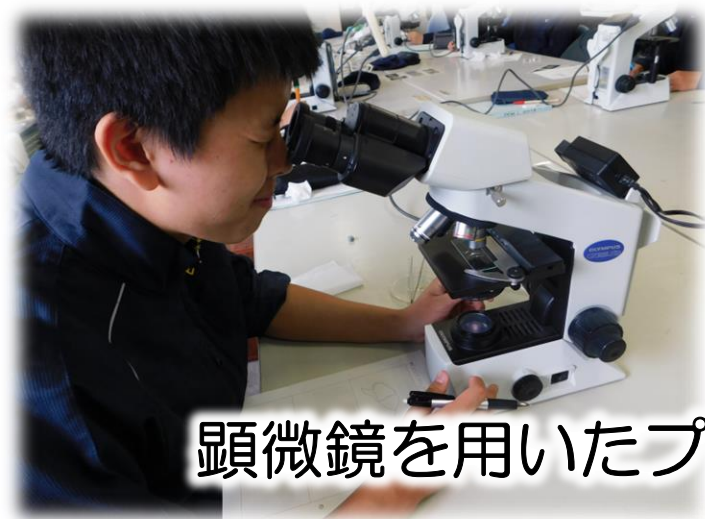
顕微鏡を用いたプランクトンの観察