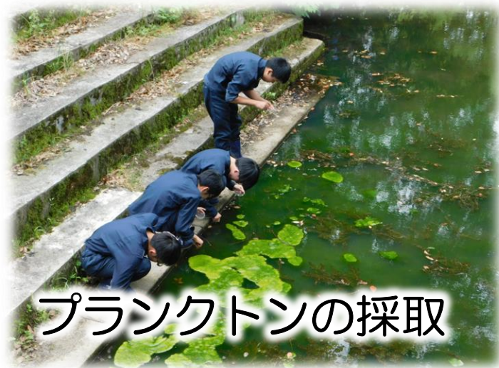
プランクトンの採取