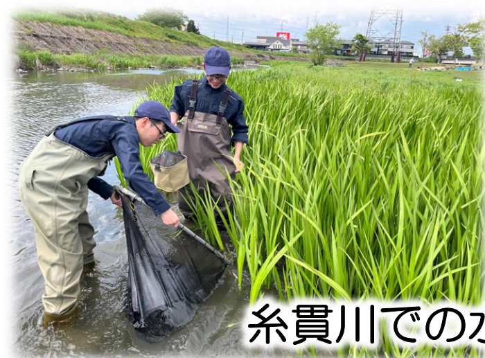
糸貫川での水生生物調査