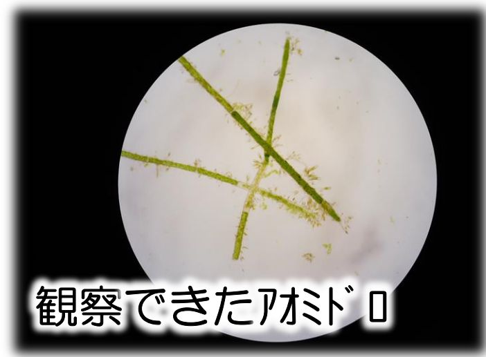
観察できたアオミドロ