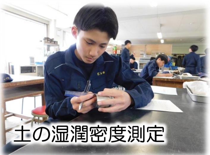
土の湿潤密度測定