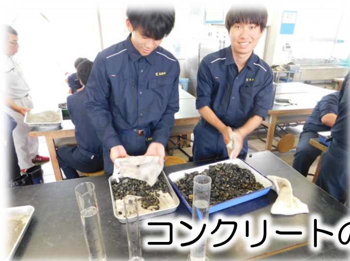
コンクリートのスランプ試験