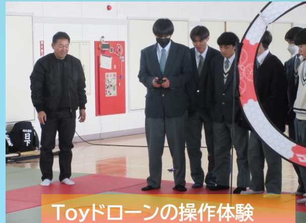
Toyドローンの操作体験