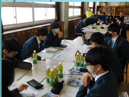
「建設産業」のイメージ = Before =