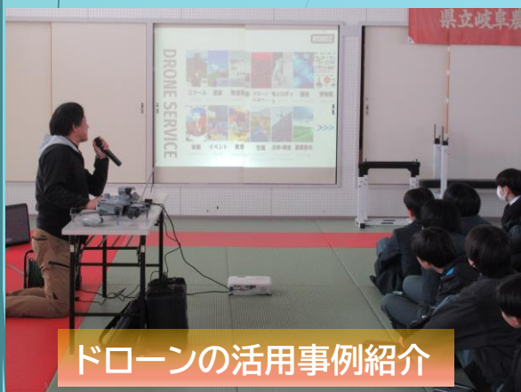
ドローンの活用事例紹介