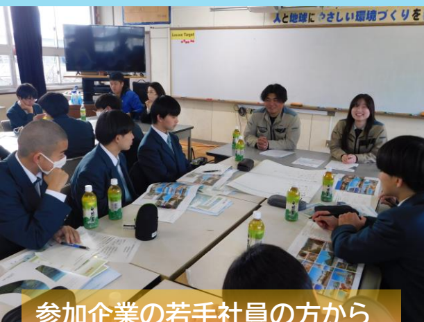
参加企業の若手社員の方から 実際についての説明を受ける