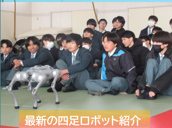
最新の四足ロボット紹介