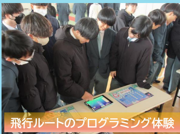
飛行ルートのプログラミング体験