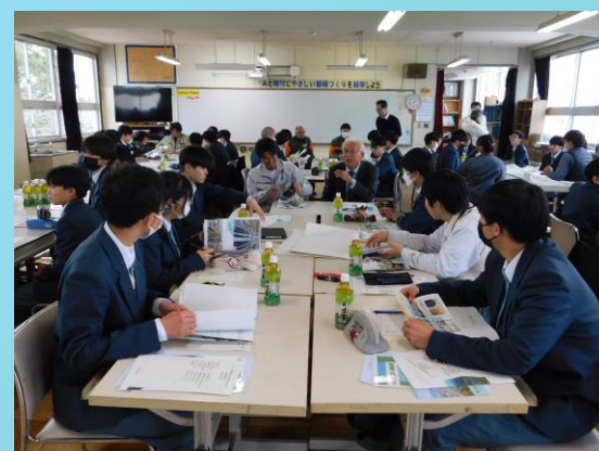
「建設産業」のイメージ = After =