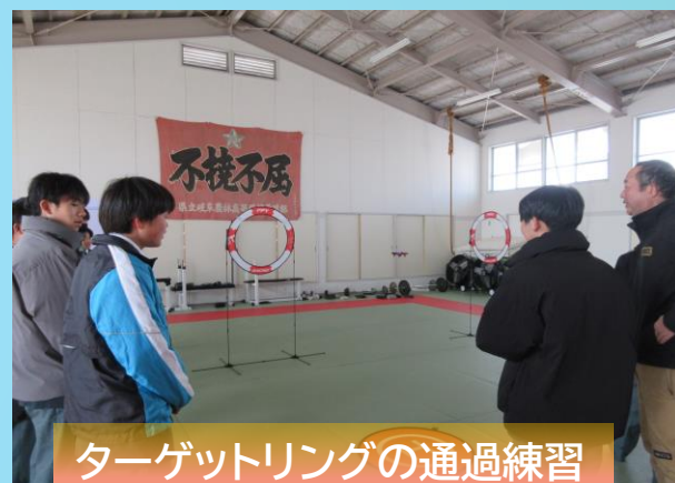
ターゲットリングの通過練習