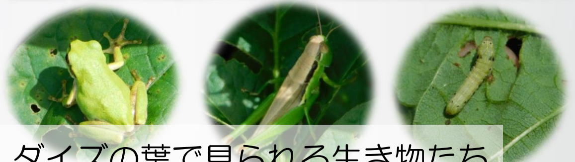
ダイズの葉で見られる生き物たち

丹波黒大豆の栽培を行っています。基本的な栽培方法を学ぶとともに、各班で研究テーマを決め、栽培実験を行っています。