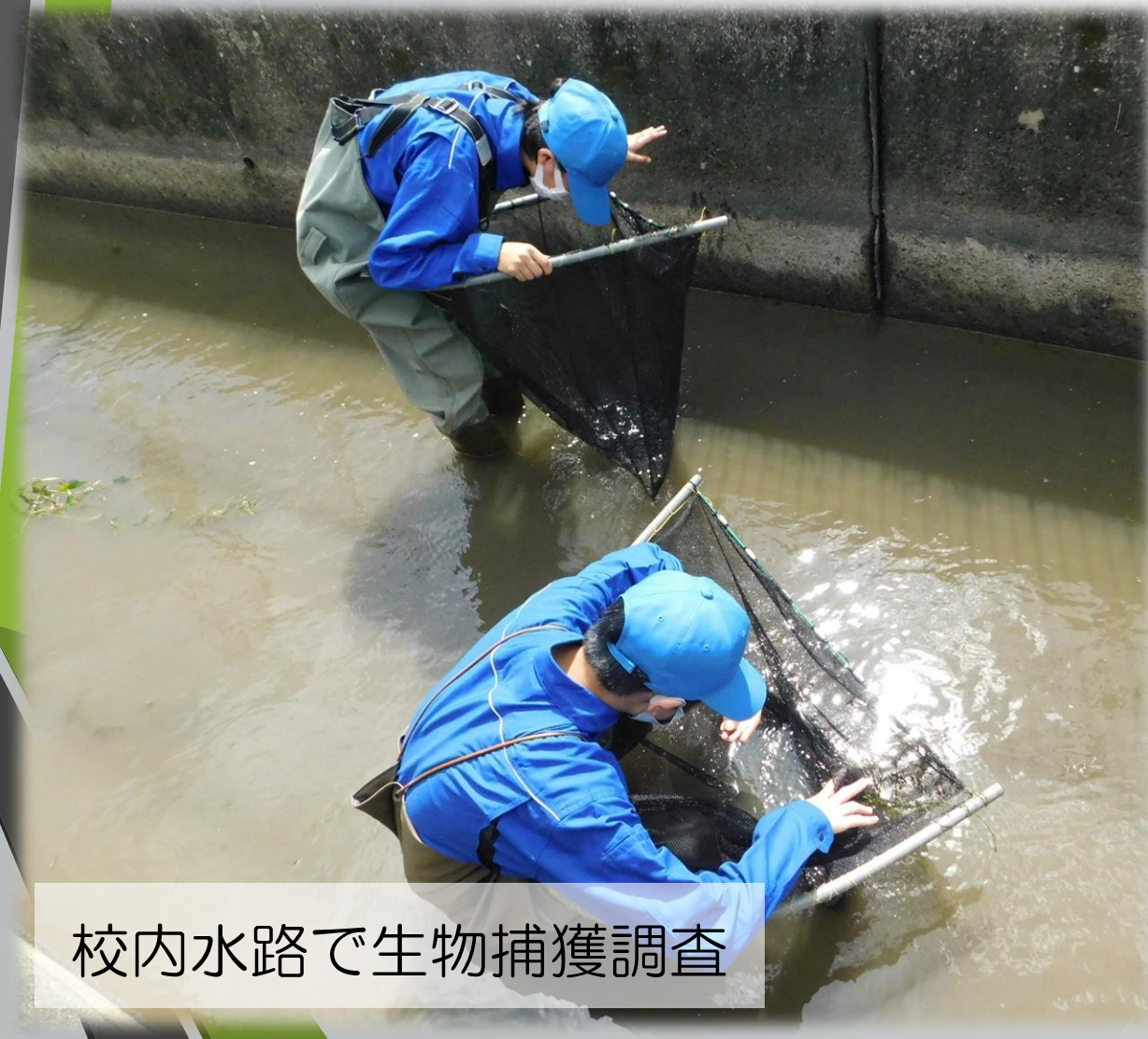
校内水路で生物捕獲調査