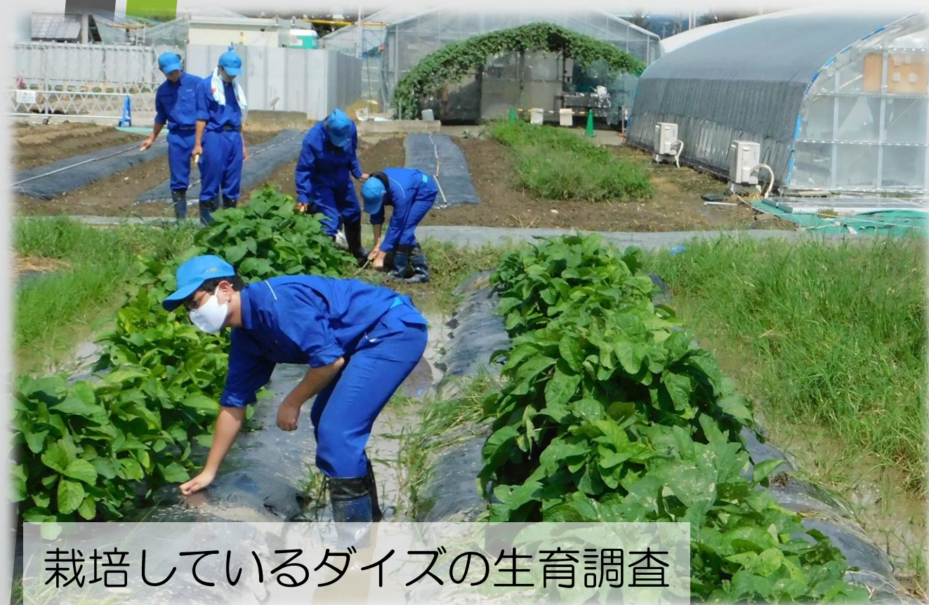
栽培しているダイズの生育調査