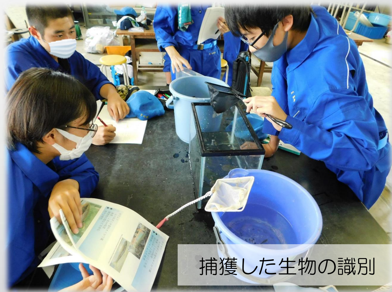
捕獲した生物の識別