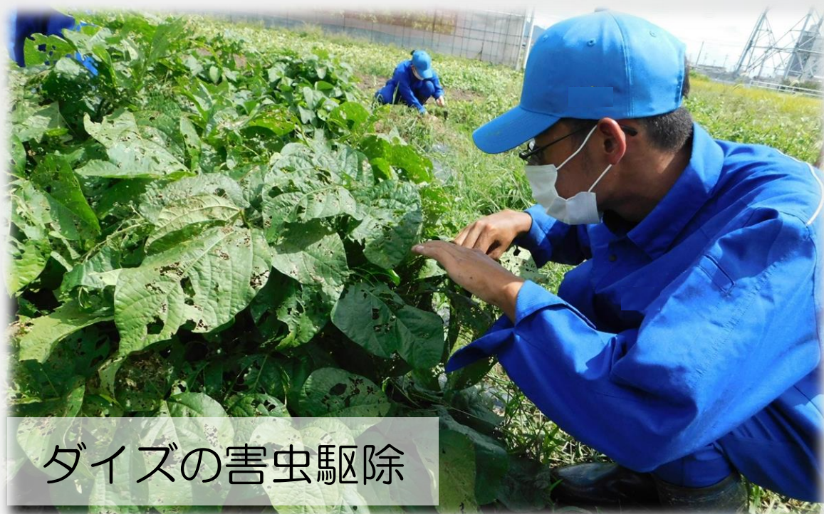
ダイズの害虫駆除