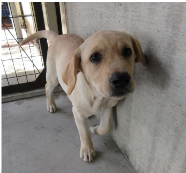
ラブラドルリトリバー 月齢3か月 なつ（夏生まれのため）