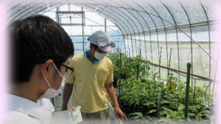
アボカドの温室栽培