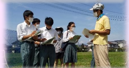
アボカドの露地栽培