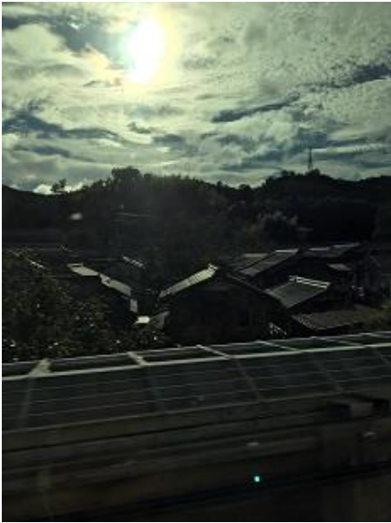
（ ↑ 新幹線内からの景色）

初日は、長崎平和公園に訪れました。平和祈念像の前では、クラスごとに記念撮影を行いました。テレビなどでは目にすることがあっても、直接見ることは中々できないので、良い機会になりました。