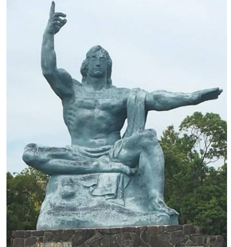
（ ↑ 平和祈念像）