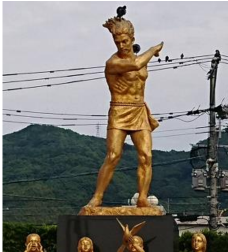
（ ↑ 原爆殉職教え子と教師の像）

まず左の写真は、朝の新幹線内からの景色になります。雲一つない青空ではありませんが、穏やかな天気恵まれ、無事新幹線に乗り込みました。生徒の皆さんにとっては、車内から楽しい旅行の始まりですね。