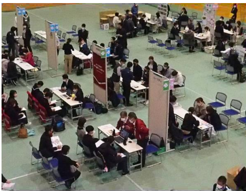
【説明会会場の様子】

11月22日(金)に、「恵那市・中津川市企業・福祉事業所等合同説明会」が東美濃ふれあいセンター(中津川市)で開催されます。恵那市雇用対策協議会及び中津川市が主催するもので、今年で6年目となります。