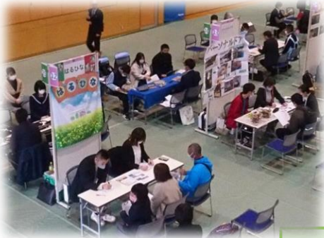
【説明会会場の様子】

11月17日（木）東美濃ふれあいセンターにて「恵那市・中津川市 企業・福祉事業所等合同説明会」が開催されました。高等部の1、2年生と中学部3年生の生徒と保護者が参加しました。説明会には、当校の生徒や卒業生が実習したり実際に就職したりしている会社や事業所など合計25事業所の出展ブースがあり、生徒は自身の実習先や卒業後の進路を考えながら希望の事業所ブースを訪れていました。保護者と一緒に説明を聞いて大切なことをメモしたり、知りたいことを質問したりするなど、とても熱心な姿がたくさんみられました。