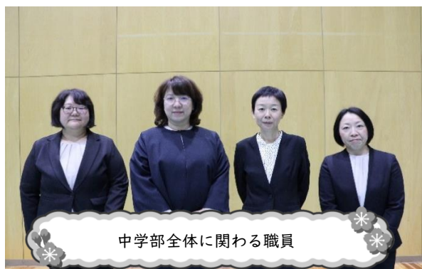
中学部全体に関わる職員