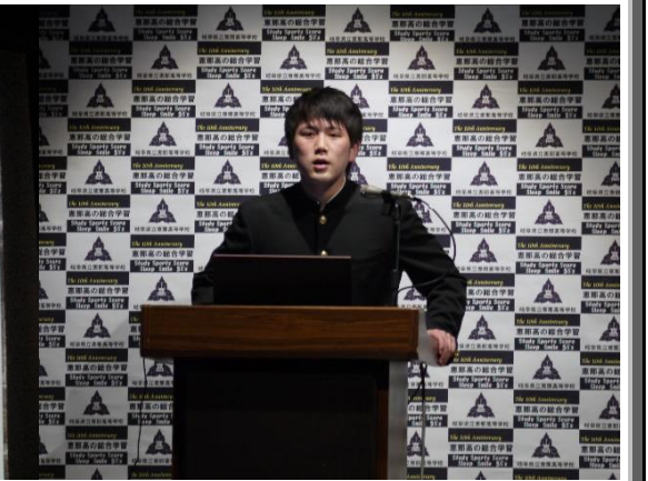
代表者の堂々とした発表の様子です。

恵那高校の総合的な学習の時間「生き方我が道」では進路につながる分野や興味のある分野について、各個人で仮説を立てて検証し、考察してきました。このような手法は新しい入試改革に対応するものとなっています。ここで得た成果は大学受験や、進学後の研究活動に非常に役立つものとなっています。