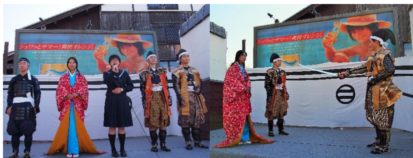
演劇部は、岩村町で行われた「おかげ祭り」に参加しました。女城主の物語を演じました。