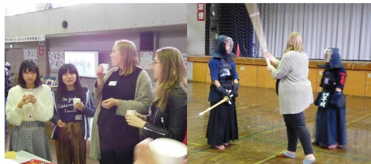
剣道部と英会話部が恵那市国際交流イベント「ワールドカフェ」で日本の伝統文化「剣道」の紹介をしてきました。