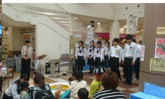
音楽部です。恵那ピアノでの演奏風景です。幼い子供や買い物中の方々に楽しんでいただきました。