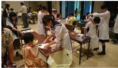
恵那市科学の祭典