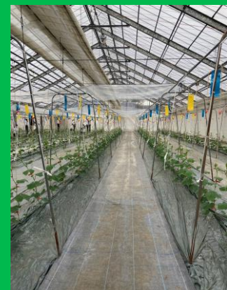
右：棚ひも設置完了