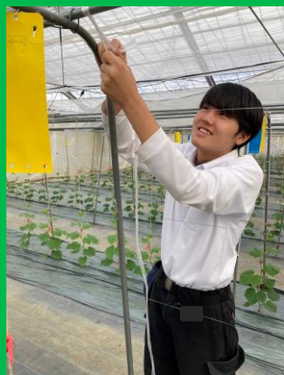
中左・中右：作業の様子