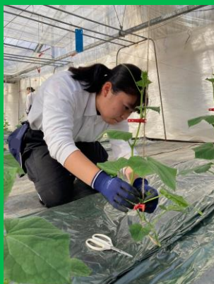
右：下位節の芽かき