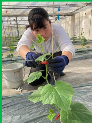
中：8節目に誘引ピンチ