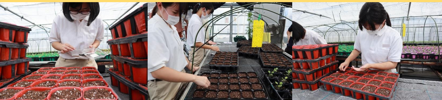
タマネギ播種の様子