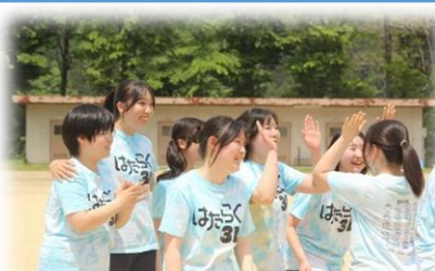
クラスの仲間との絆が深まりました!