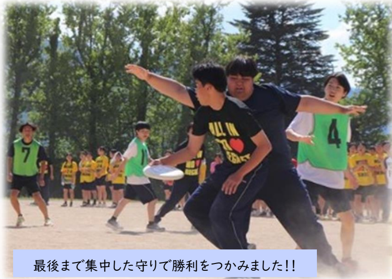
最後まで集中した守りで勝利をつかみました!!