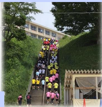
色とりどりのTシャツが99段階段を華やかに彩りました