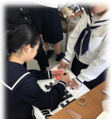
手作りTシャツでクラスで団結!

結果は以下の通りです。 女子の部：1位 3A①チーム、2位 3B①チーム、3位 3C②チーム 男子の部：1位 3AB 合同チーム、2位 3C チーム、3位 2B チーム 校庭には終始歓声が響き渡り、クラスの絆が深まる充実した一日となりました。