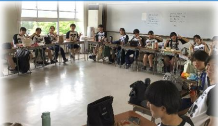
輪になって楽しむお弁当時間も笑顔がいっぱい!