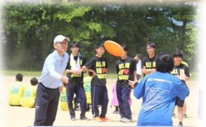
校長先生も全カプレー!