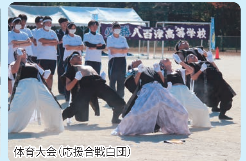
体育大会(応援合戦白団)