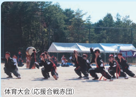
体育大会(応援合戦赤団)