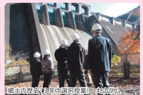
郷土の歴史(3年次選択授業) 丸山ダム