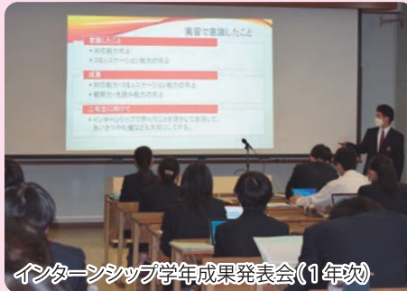
インターンシップ学年成果発表会(1年次)