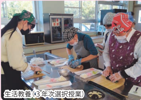
生活教養(3年次選択授業)