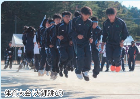
体育大会(大縄跳び)