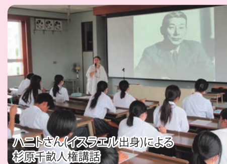
ハニトさん(イスラエル出身)による 杉原千畝人権講話