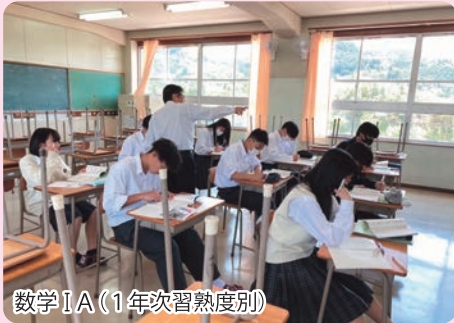
数学ⅠA(1年次習熟度別)