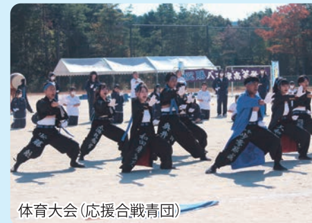
体育大会(応援合戦青団)