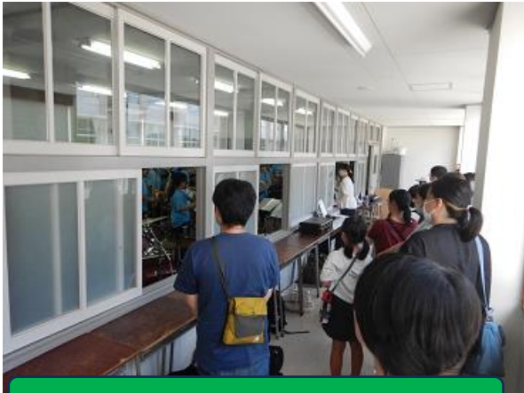
吹奏楽部の演奏を聴いていただきました