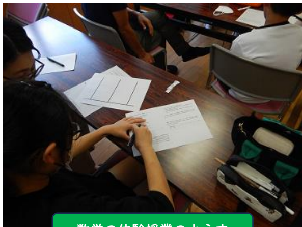
数学の体験授業のようす