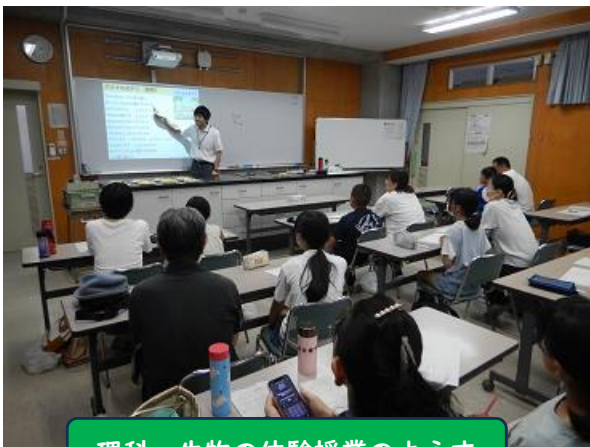
理科・生物の体験授業のようす