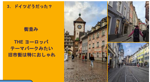
ドイツ研修の報告