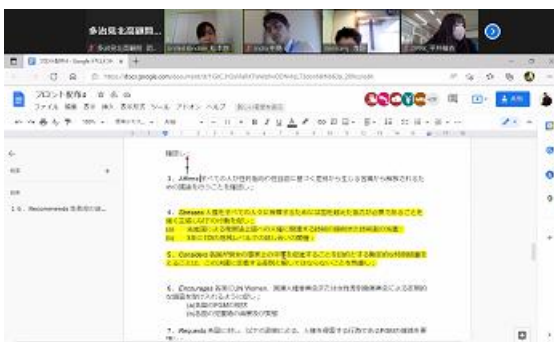
決議案の文章を練りあげているところ