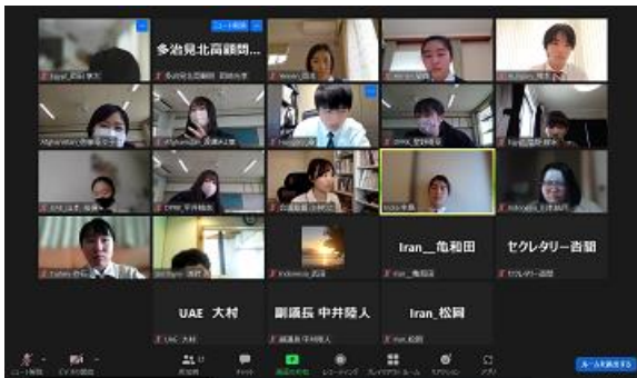
各部屋に分かれて協議、交渉