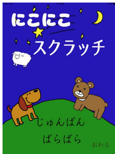
にこにこスクラッチ