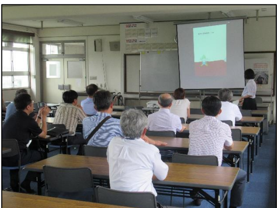
[生徒による作品(スマホアプリ)紹介]