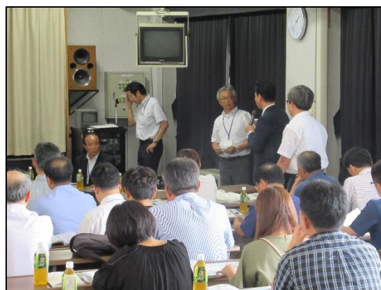
[韓国の訪問団長挨拶]