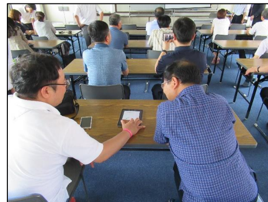
[スマホアプリ体験]