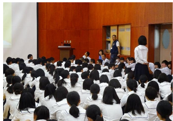
感想や質問の時間には多くの発言あり