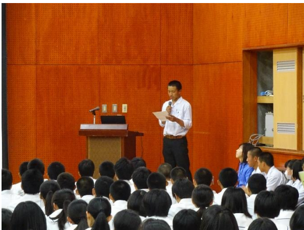
司会進行も生徒がつとめる