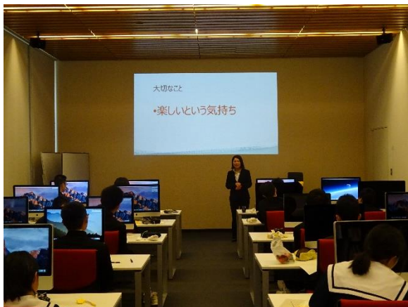
開発者だけでなく利用者も「楽しい」ことが大切