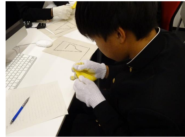
軍手をはめて折り鶴を折る