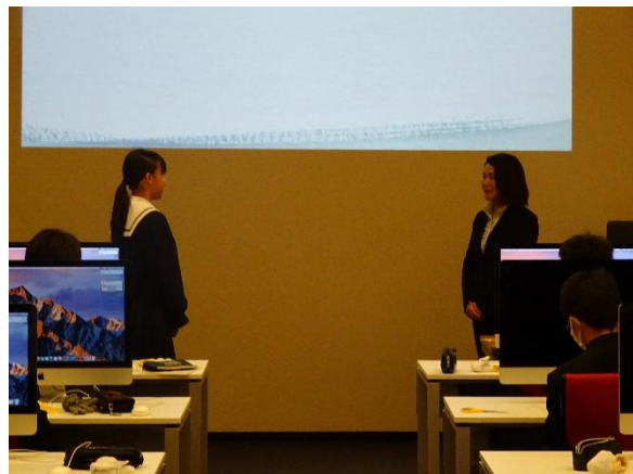
生徒代表御礼のことば