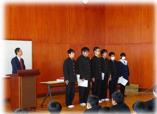
情報科集会での表彰伝達