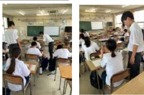
美濃加茂東中学校