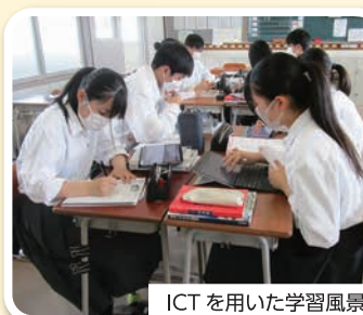
ICTを用いた学習風景