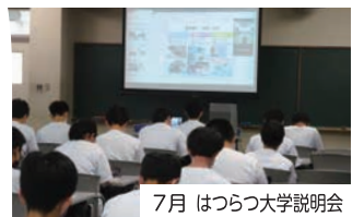
7月 はつらつ大学説明会