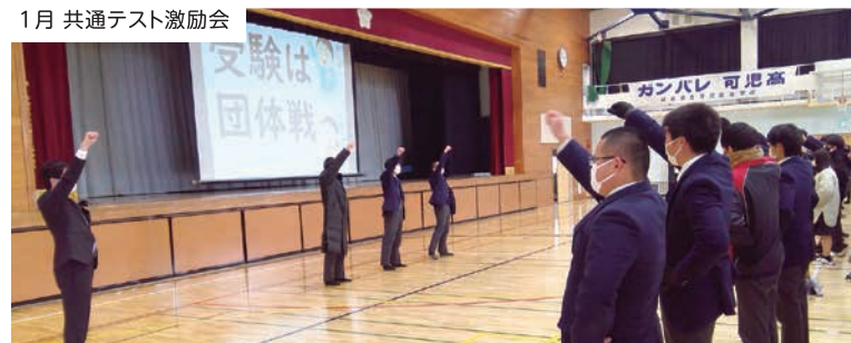
1月 共通テスト激励会