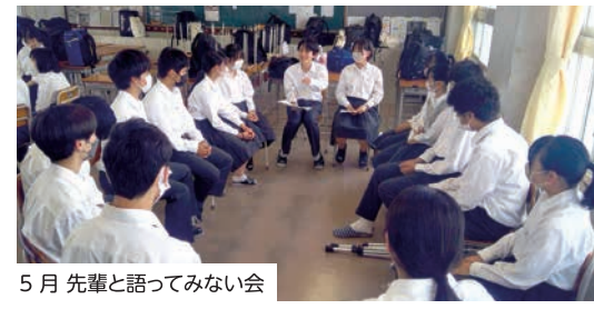
5月 先輩と語ってみたい会