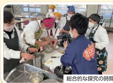
総合的な探究の時間