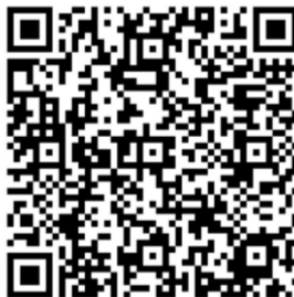
欠席等連絡フォーム QR コード