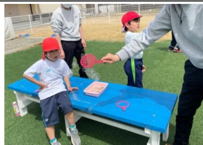
クラスの友達とシャボン玉 (なかよし広場)

小学部は、新入生1名が仲間に加わり、18名で学習活動を始めました。今年度の学部のスローガンは、『ピース』です。児童一人一人の「できた!」や「がんばった!」「たのしい!」「力いっぱい!」等の姿をめざして、達成したときには、友達と一緒に“ピース”をして、“ピース”になれた姿をみんなで喜んだり、感じたりできるように取り組んでいけたら、と思います。『ピース』を合言葉に1年間頑張ります。