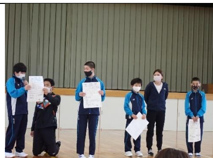
全校の仲間に自己紹介 (新入生を迎える会)

中学部は、新入生5名が仲間に加わり、11名で新学年を始めました。『シャイニング🌻11 (イレブン) ~自分で!仲間と!リスペクト!~』を今年度の中学部の目標として取り組みます。11人一人一人が太陽のように輝ける(=シャイン)ようにという思いが込められています。『自分で!』『仲間と!』『リスペクト!』の3つの力を育てていきたいと考えています。1年間よろしくお祈りします。