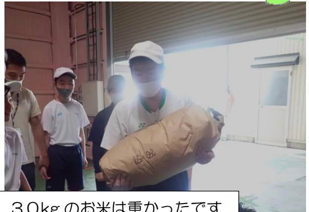
30kgのお米は重かったです