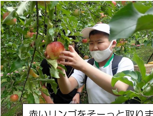
赤いリンゴをそーっと取りました