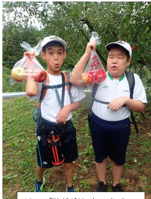
リンゴ狩り楽しかったよ