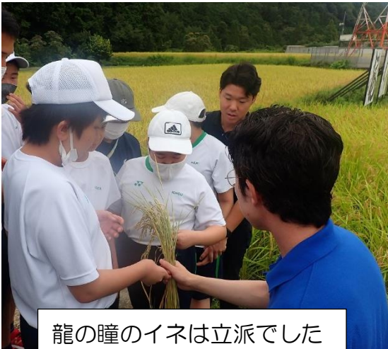
龍の瞳のイネは立派でした