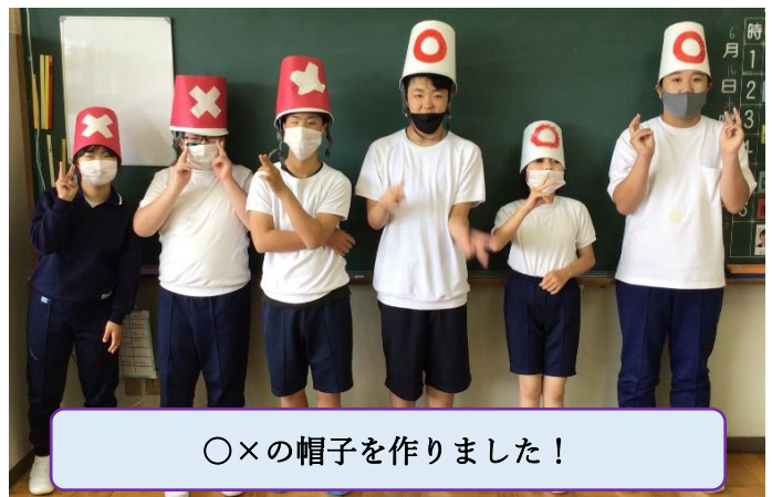
〇×の帽子を作りました！