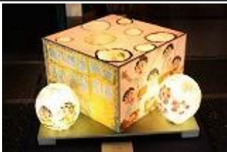
第20回 「美濃和紙あかりアート展」 入選作品

本校では、地域の特色である和紙を用いた教育活動に力を入れて取り組んでいます。教育活動で和紙あかり作品を制作したり、制作した作品を美濃市で開催される「美濃和紙あかりアート展」に出展したりしています。また、中濃地域から和紙の専門家や外国人アーティストを講師に招き「紙と光のワークショップ」を校内で開催したりしています。