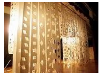
高等部ワークショップ作品 「KAWA NO JI」