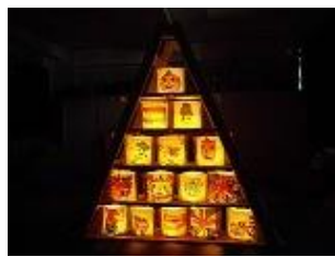
中学部ワークショップ作品 「和紙ランプツリー」