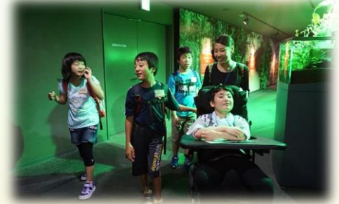
みんなでワイワイ！わくわく！たのしいな