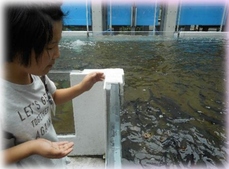
さかなにえさをあげたよ！

小学部6年生は、「生き物博士になろう！」という目標をたて、「アクア・トトぎふ」にいる生き物について調べました。最大級の淡水魚の大きさや重さについて調べたり、身近に生息している魚を実際に川へ出かけて捕まえて、飼育したりして、いろいろなことを学びました。