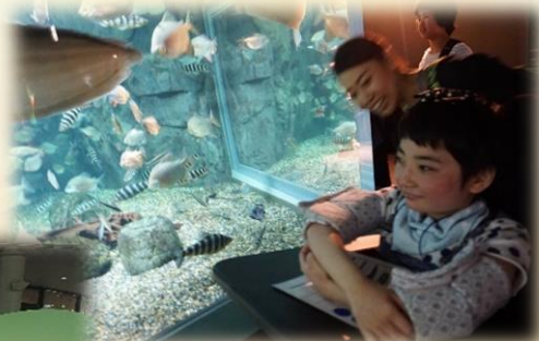
キラキラ光るさかなたちに