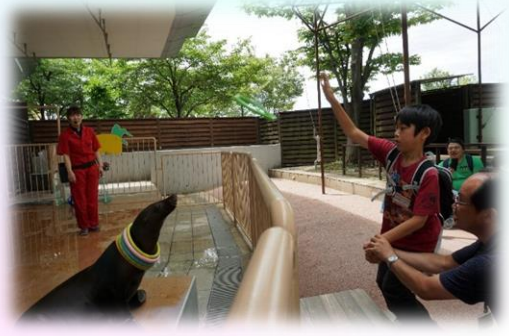
アシカのマリンちゃんに輪を投げたよ！