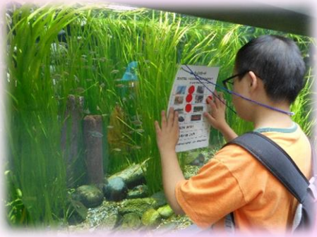
ミッションカードを見ながら見学したよ！