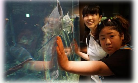
大きなさかなにびっくり！

生き物に興味がでてきた6年生。修学旅行でいく「二見シーパラダイス」も今から楽しみです。