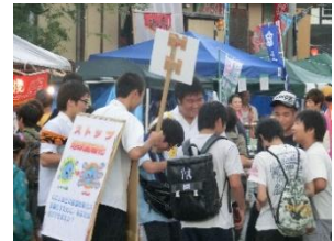
▲よってりやあみたけ ボランティア