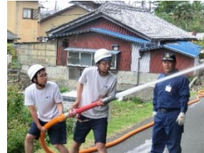
▲消防団の役割

や豊富な経験を生徒に伝えていただいています。他方、生徒たちも地域のボランティア行事に参加するなど、地域との交流を深めています。