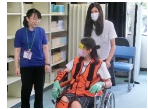
▲高齢社会と地域 (御嵩町保険長寿課)