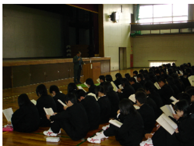
オリエンテーションの様子

また部活動の登録も終了しました。いよいよ本格的に土岐商業高校での部活動がスタートします。頑張りましょう。