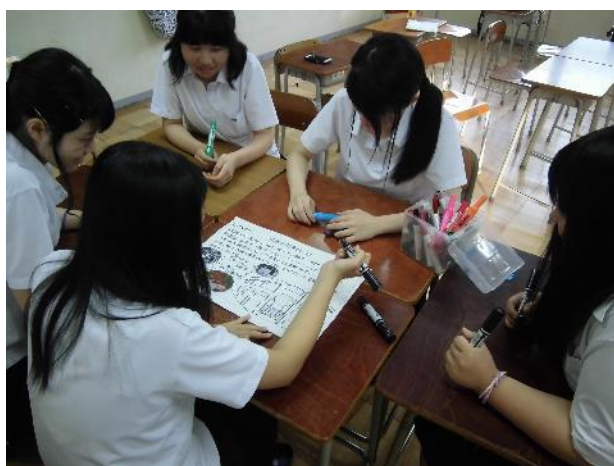
写真1 ポスター作製の様子

作成したポスターは、生徒昇降口に掲示してあり、全校生徒に向けて自然科学コースの活動をアピールする機会にしています。