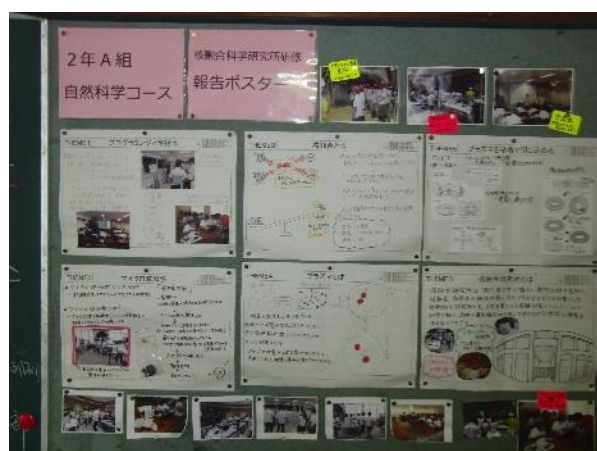
写真3 ポスター掲示 I