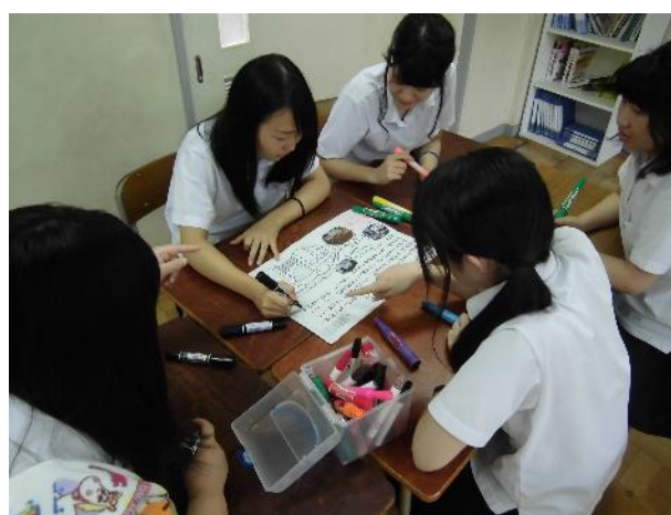
写真2 研修内容を活発に交流しています。