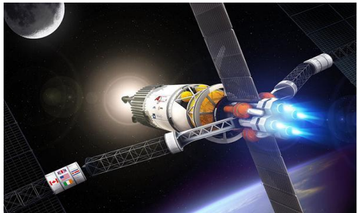
図 1 NASA で研究が進められる火星探査用プラズマロケット(想像図)

この燃費の悪さはロケットが開発されてからの 90 年間ほとんど変わっていません。ロケットの燃費の悪さが長年の間、宇宙開発の大きな障害となってきました。今から 50 年前にアポロ計画で人類が月に行った後に再び月に行った人がいないのは、ロケットの燃費が悪くお金がかかりすぎるからです。人類が再び月に行ったり、その先の火星に行くに