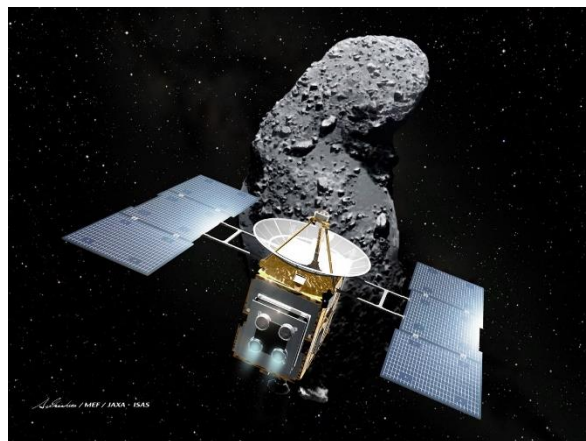
図 2 探査機「はやぶさ」

2010 年に地球に帰ってきた探査機「はやぶさ」は 60 億 km にも及ぶ旅をたった 70kg の燃料によって達成しました(図 2)。この旅は「はやぶさ」に搭載されたプラズマロケットの燃費の良さのお陰で可能になりました。「はやぶさ」では燃料に割く重量が減ることでカメラやレーダー、物質分析装置などの実験装置をより多く搭載することが可能になり、小惑星ができる仕組みから太陽系ができる仕組み、そして地球に生命が誕生した理由などの研究に役立つ数多くのデータを取ることに成功しました。