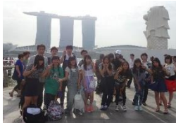
海外体験研修（シンガポール・マレーシア） H29. 12. 23~28 (6日間)