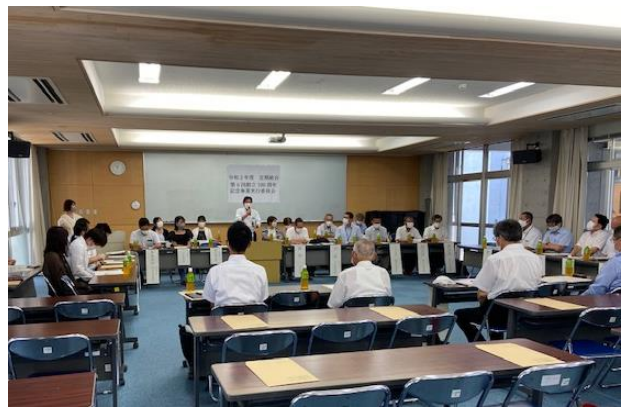
総会・実行委員会の様子