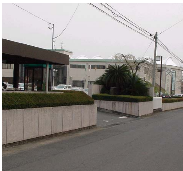
①仮の一方通行入り口（北より）