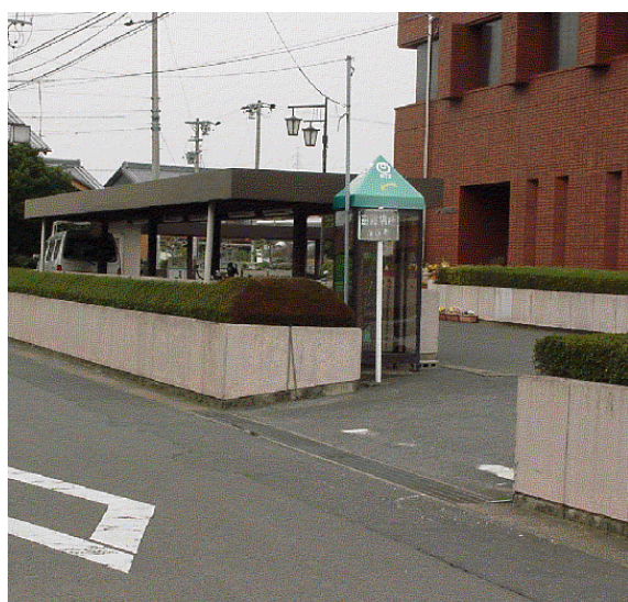
①仮の一方通行入り口（南より）