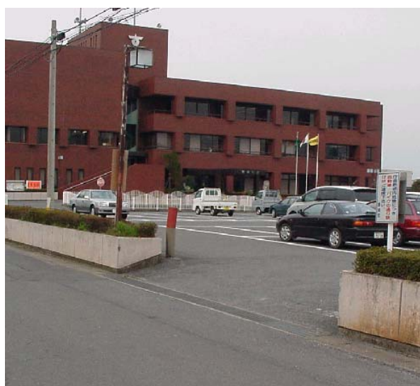
②仮の一方通行出口（南より）