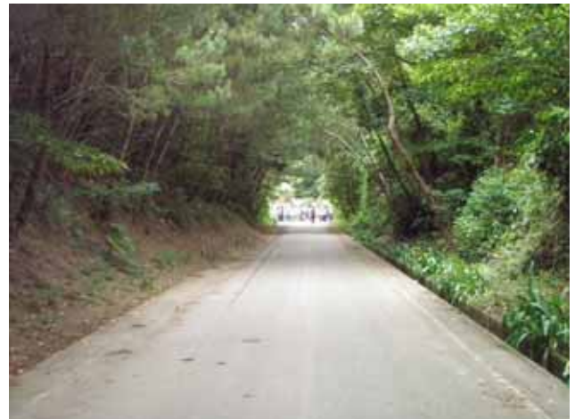
向こうが下りに見える「おばけ坂」