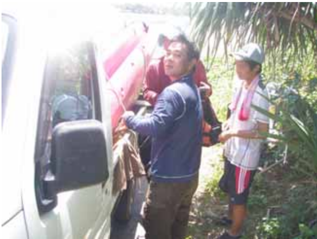
カヤックをトラックに積み、ロープで固定、 おじさんから、ロープの指南を