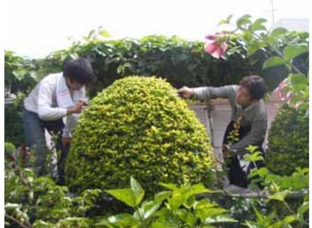
まず、家の手伝いが基本