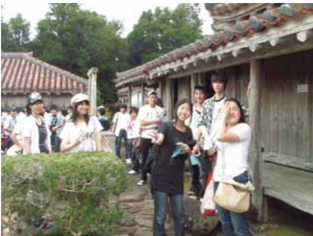
うえづ家(琉球時代)を見学