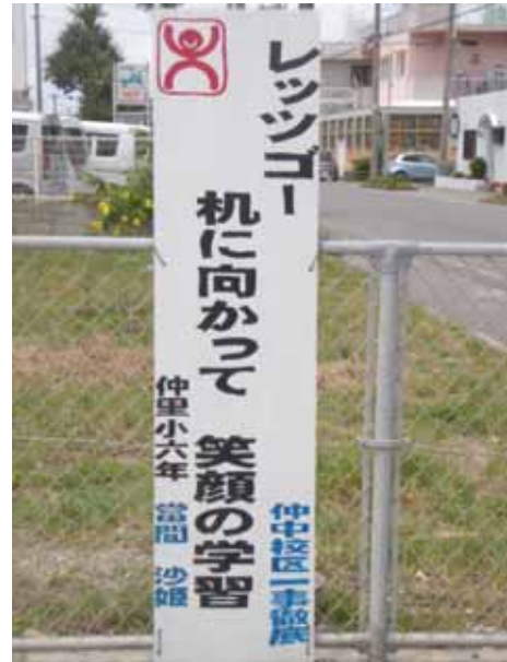
ん～ 私たちの標語です。