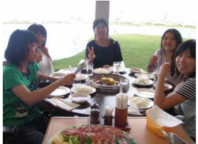
ホテルの夕食はバーベキュー