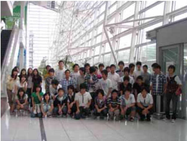
セントレアでまず集合写真