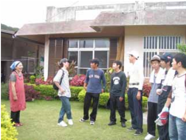
ホームビジットはアットホームです。