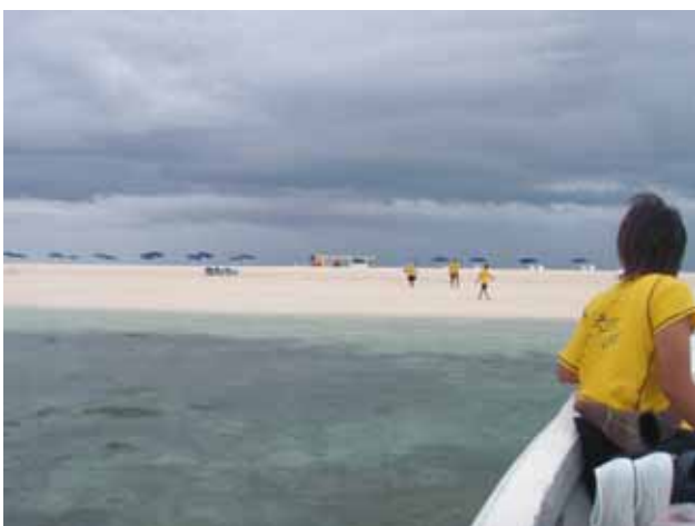
3日目は、世界で2番目のリーフへ