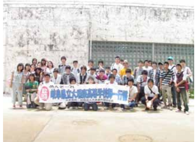
久米島に到着 大歓迎を