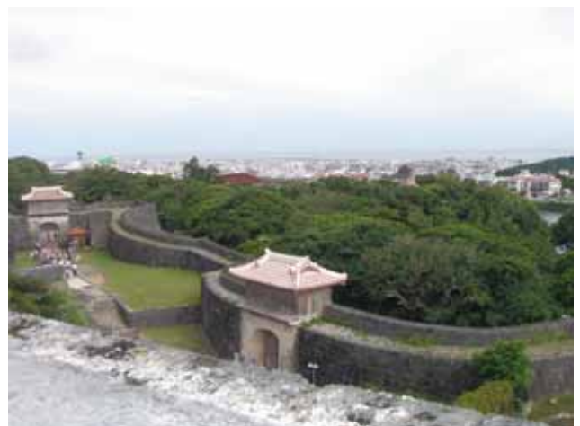
60年前、ここが戦場に