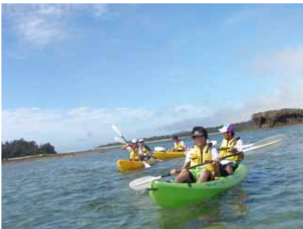
シーカヤック体験