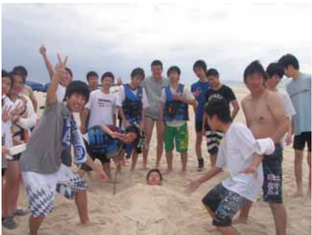
一度やってみたかった！！