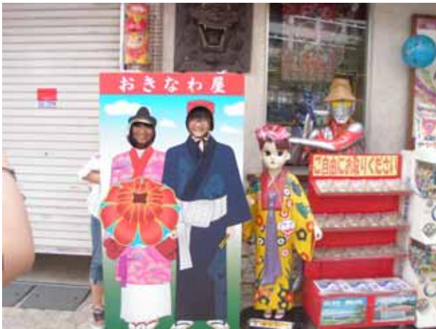
国際どおりのみやげ物やでワンショット