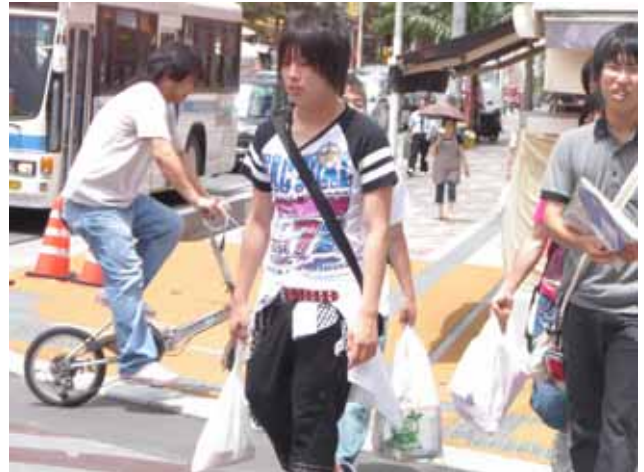
旅の最後は買い物を