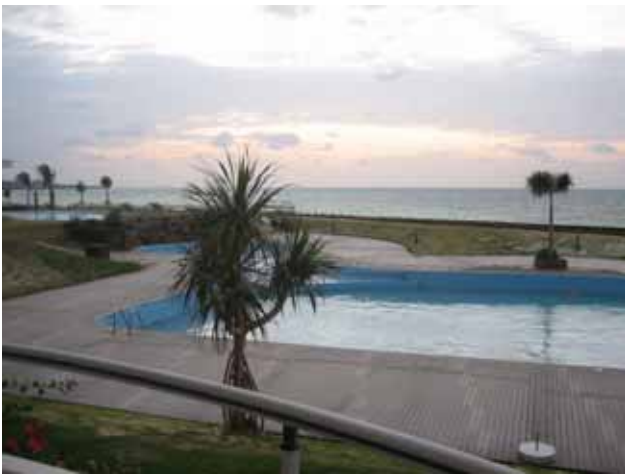
イーフビーチホテルの部屋から海を望む