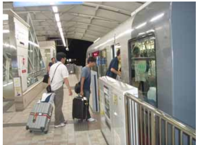
夜の便で那覇へ、ホテルへはユイレール