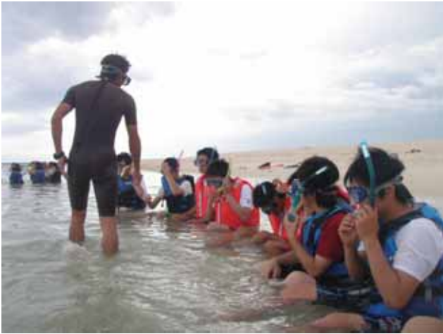
シュノーケリングのレッスン開始