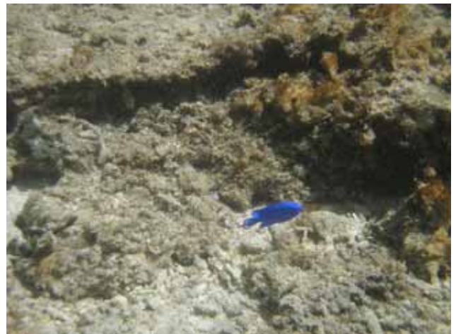
海の中は熱帯魚が泳ぐ