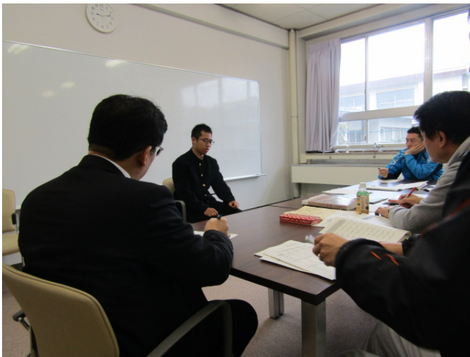
個人面談（受験相談）

平成30年3月20日（火）に情報技術科2年生の国立大学受験希望者7名を対象に国立大学受験説明会兼学習会が実施されました。