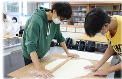
うどんを「のして」います