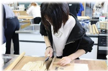
うどんを切ります