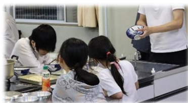
おいしくいただきました