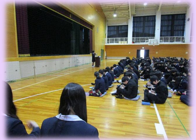
真剣に話を聴く様子

勉強と部活動の両立、1・2年次生のうちにやっておけばよかったと後悔していることなどを聴くことができ、有意義な時間となりました。