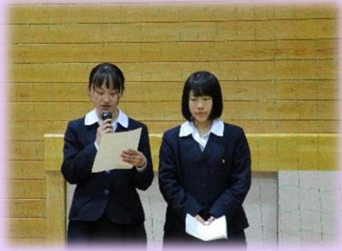
積極的な質疑応答