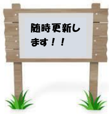
JICE 担当者による説明