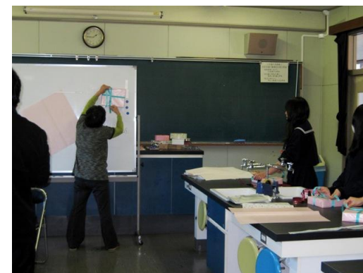
10/28「商品包装技術」の授業の様子