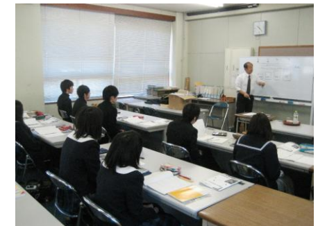
10/29「日商簿記検定1級」講習の様子