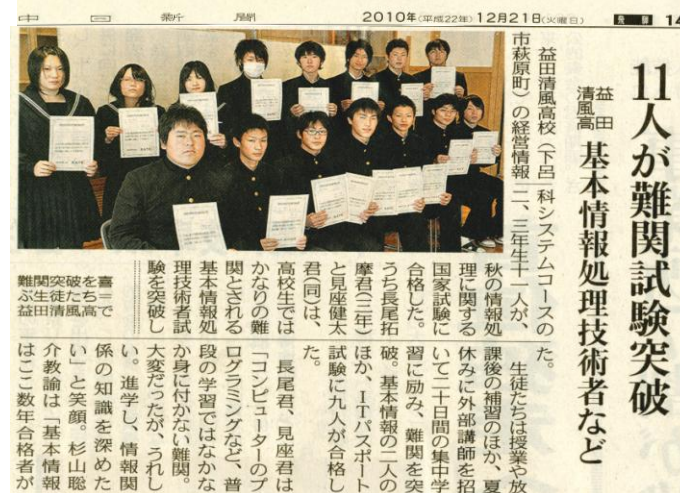
平成22年12月21日(火) 中日新聞掲載

僕は春に基本情報技術者試験を受験しましたが、その時は午後の試験が合格点に届かず不合格という結果でした。とても残念でしたが、秋にもう一度チャンスがあるのでこの結果から自分の足りないところを分析し、次は必ず合格するためにさらに勉強に励みました。午後の問題はしっかりと自分で解く力を身につけないと出来ないの、時間をかけて確実に解いて問題に慣れていくように勉強しました。こうして、前回の失敗を活かして合格につなげることができ、前回40%台だった午後の正答率を、70%台に上げることができました。これは自分にとってとても大きな自信になったのでさらに上の試験にも挑戦し、自分の力を高めていきたいです。 経営情報科 3年生