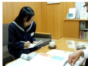
実習先：十六銀行 益田支店