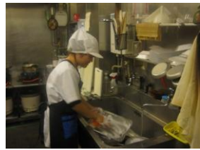
実習先：味の四季彩