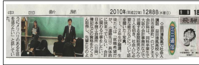
平成22年12月8日(水) 中日新聞掲載

社会人に必要な能力や成功する人の3要素など、とても分かりやすく説明してもらったのでとてもよかったです。また、生活にメリハリをつけると良いと聞き、今の自分にはできていないことなのでこれからの生活で気をつけていきたいと思いました。