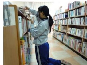
実習先：萩原図書館