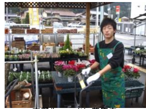
実習先：コメリ 萩原店