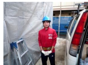
実習先：アーク電気

販売の仕事は毎日たくさんのお客さんと接することになるので、すぐ気を遣うと思いました。それでもいつも笑顔で働いている従業員の方を見て本当にすごいと思いました。お客さんが店に入ってきた時やレジを済ませた時、お店を出て行かれる時に大きな声で挨拶をしている姿をたくさん見ました。あいさつはお客様とのコミュニケーションをとるためにすごく大切だと思ったし、あいさつした時、すごく気持ちよかったです。「ありがとうございました」と言った後に、「ありがとう」と言って下さった時はすごく嬉しくて、お客さんと接する仕事は良いなと思いました。3日間でたくさん学べたのですごく勉強になりました。