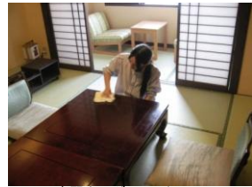
実習先：グリーンホテル