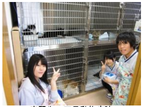
実習先：下呂動物病院