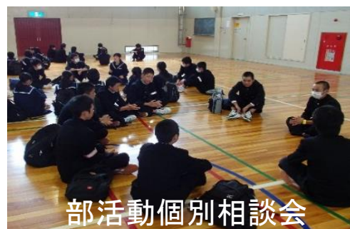
部活動個別相談会