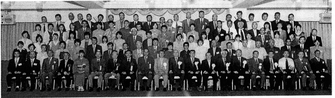
平成15年度華陽フロンティア高等学校同窓会総会 平成15年8月3日 於 岐阜会館

発行 岐阜市西鶉6の69 華陽フロンティア高等学校同窓会 電話〈275〉-7185 発行責任者 樽谷毅 印刷 サンメッセ株式会社