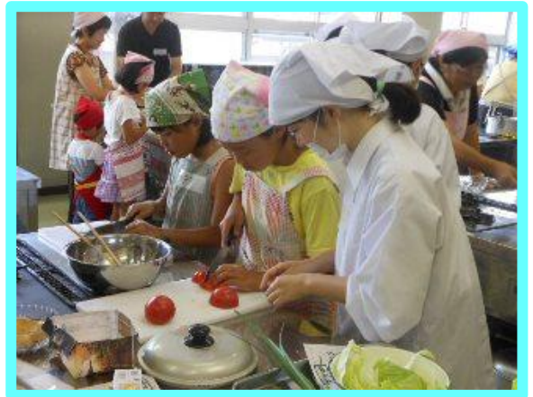
調理のサポートをしています。