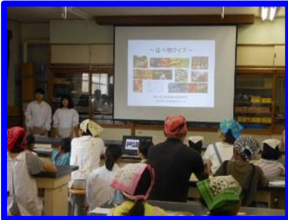
食べ物クイズをしました。

食生活コース3 年生 (10 名) が岩野田地区食生活改善推進協議会主催の小学生親子料理講習会のサポートをしました。小学校 6 年生までの親子 12 組が朝食メニューに挑戦しました。