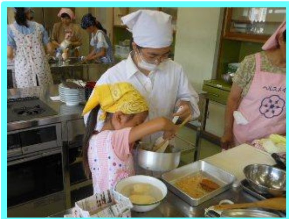
一緒にきな粉あめを作っています。